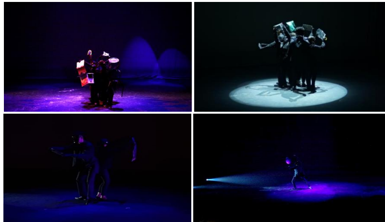
ภาพที่ 7 ลีลาการเคลื่อนไหวที่ใช้ประกอบการแสดงมายากล

องค์ที่ 7 การอันตรธาน ใช้ลีลาการเคลื่อนไหวของลีลาการแสดงมายากล และการลดแสงเพื่อให้ภาพหายไปจากผู้ชม