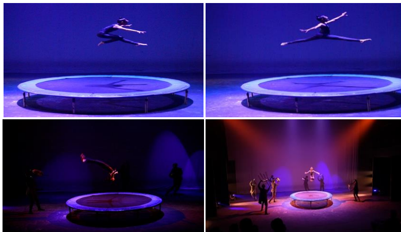
ภาพที่ 6 ลีลาบัลเลต์, ลีลาโยมนาสติก

องค์ที่ 6 การต้านกฎธรรมชาติ ใช้ลีลาบัลเลต์ และลีลานักกีฬาโยมนาสติก เพื่อแสดงบนอุปกรณ์แตรมโพลีนแสดงให้เห็นถึงเทคนิคการลอยตัวต้านแรงโน้มถ่วง และใช้ลีลาการเคลื่อนไหวในชีวิตประจำวัน (Everyday Movement) โดยถืออุปกรณ์ประกอบการแสดง เช่น กล้องลิ่ง แก้วน้ำ หนังสือ เพื่อเห็นถึงเทคนิคการลอยตัวต้านแรงโน้มถ่วง