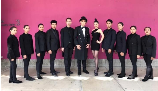
ภาพที่ 12 การแต่งกายโดยใช้สูทแบบสากล

7. การออกแบบพื้นที่แสดง ผู้วิจัยได้ใช้โรงละครในลักษณะของแบล็ค บ็อก เธียเตอร์ (Black Box Theatre) เป็นพื้นที่ในการนำเสนอผลงานสร้างสรรค์ครั้งนี้ ลักษณะของโรงละครเป็นห้องสี่เหลี่ยมผืนผ้าที่มีพื้นที่ว่างเปล่า มีขนาดความกว้าง ความลึก สามารถนำอุปกรณ์ประกอบการแสดง เช่น ฉาก แคมโพริน เข้าออกได้สะดวก รวมไปถึงการออกแบบลิฟตานาฏยศิลป์ให้สามารถเข้าออก และเคลื่อนไหวในทิศทางตามต้องการได้ อีกทั้งสามารถจัดวางตำแหน่งผู้ชมให้รับชมการแสดงได้เพียงด้านเดียว