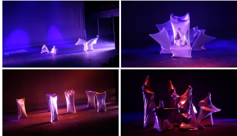
ภาพที่ 3 ลีลานาฏศิลป์สมัยใหม่

องค์ที่ 4 การคืนสภาพ ใช้ลีลานาฏศิลป์สมัยใหม่ ในการเคลื่อนไหวลีลาการละลายตัวคล้าย วัตถุที่มีขนาดแข็งให้สลายตัวแล้วคืนสภาพเป็นวัตถุที่มีขนาดแข็งตามรูปแบบเดิม