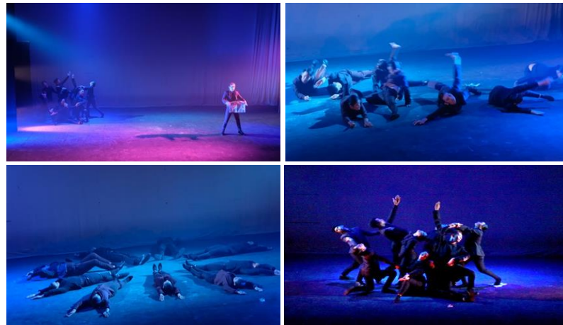
ภาพที่ 4 ลีลานาฏศิลป์สมัยใหม่

องค์ที่ 4 การคืนสภาพ ใช้ลีลานาฏศิลป์สมัยใหม่ ในการเคลื่อนไหวลีลาการละลายตัวคล้าย วัตถุที่มีขนาดแข็งให้สลายตัวแล้วคืนสภาพเป็นวัตถุที่มีขนาดแข็งตามรูปแบบเดิม